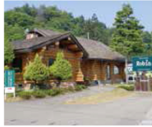
▲株式会社ロビン 高山本社