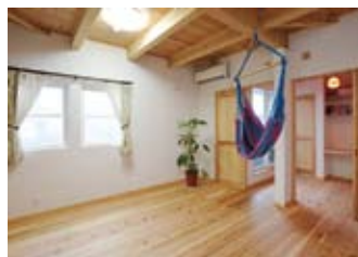
子ども室は将来を見据え2部屋にできるように設計。壁は健康にやさしいEM珪藻土