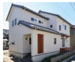
いぶし銀の瓦、塗り壁、縦格子で和風テイストに仕上げられている