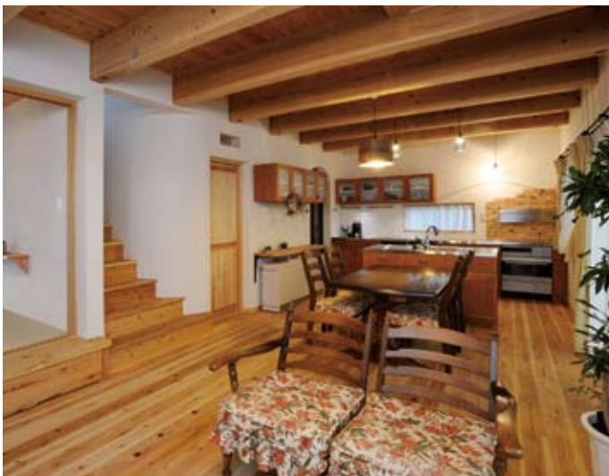
ソファのファブリックからインスピレーションを受け、和風でレトロな雰囲気にデザインされたT邸。床は杉の無垢材を無塗装で使用し、経年変化が楽しめる住まいとなっている