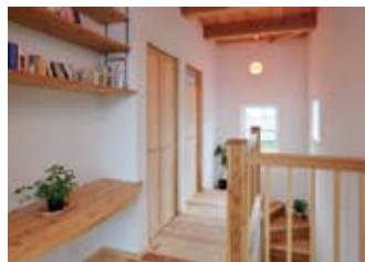
ピンクに光るランプシェードが印象的な2階ホールには本棚を設け、多目的な空間に