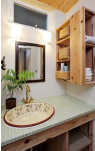
洗面化粧台はロビンオリジナルデザイン。自由度の高さとデザイン性もロビンの魅力